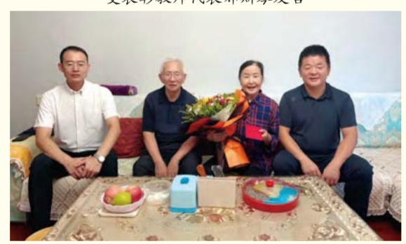
校领导一行在相关职能部门负责人陪同下，走访、慰问离退休老教师代表及一线教师代表