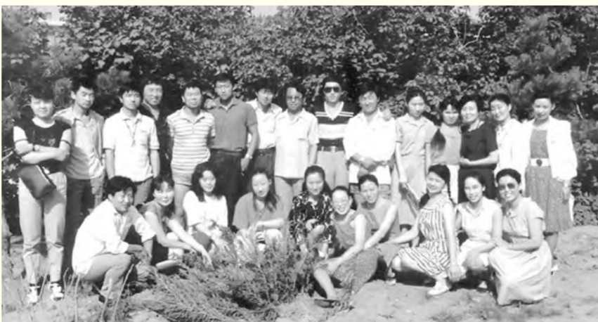
首届音乐大专班同学合影