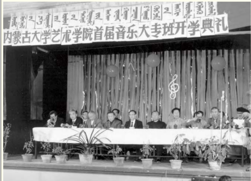
首届音乐大专班开学典礼

（作者为内蒙古艺术学院舞蹈专业毕业生，现就职于中央美术学院。此文选自《艺苑情怀》）