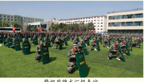
警棍盾牌术汇报表演