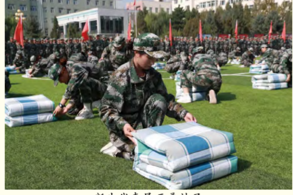
新生代表展示叠被子