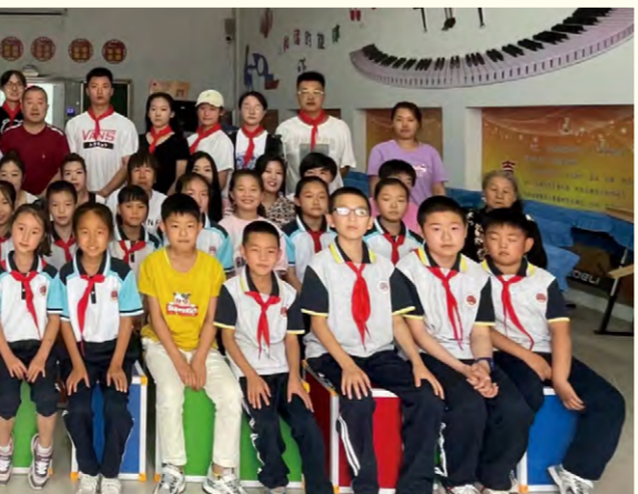
我校志愿者与学生们合影留念