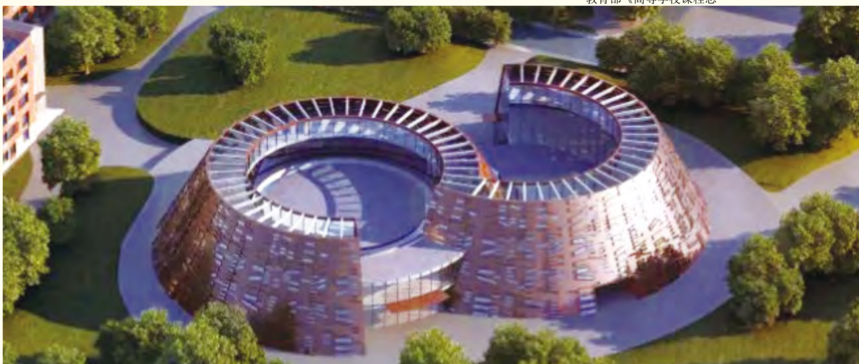
建设中的图书馆、美术馆效果图