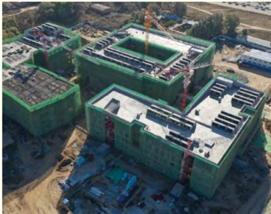
建设中的视觉传达教学楼