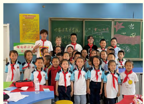
我校志愿者与学生们合影留念