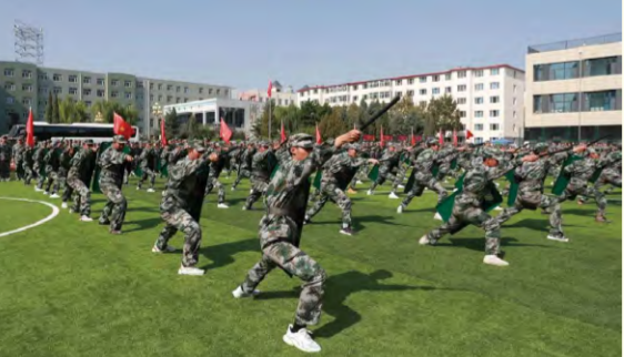
警棍盾牌术汇报表演