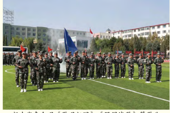
新生代表合唱《歌唱祖国》《强军战歌》等歌曲