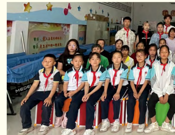
我校志愿者与学生们合影留念