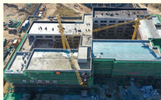
建设中的教学主楼

大力推进下,新校区建设一期工程7个单体楼(教学主楼、视觉传达教学楼、图书馆、食堂、风雨操场、运动场看台、行政办公楼)中已有4个主体建筑封顶并进行二次结构施工。全部项目于年内实现主体结构封顶,并将根据实际进展,进行二次结构、附属配套、精装修等施工作业,确保2022年9月开学达到搬迁入住条件。