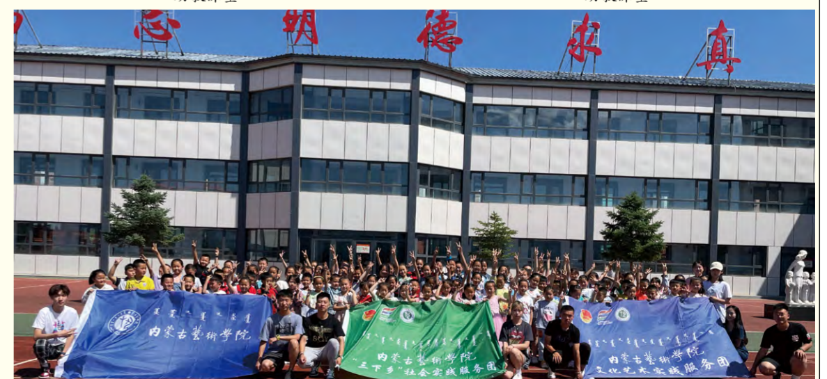
我校志愿者与学生们合影留念