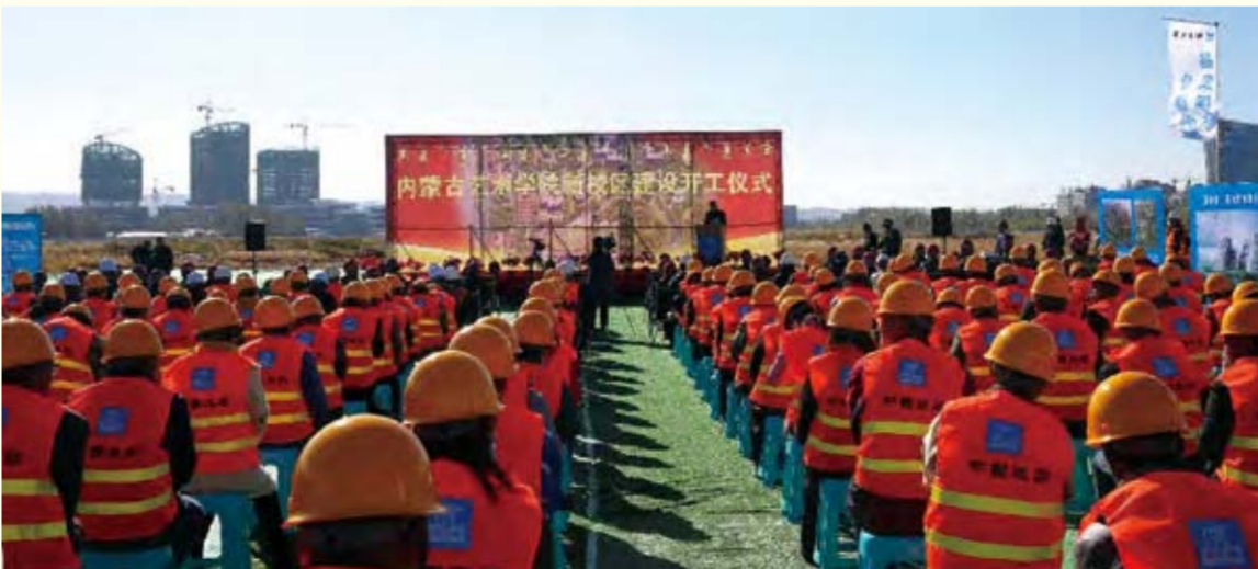
我校新校区建设工程开工仪式

开工项目为7个单体楼及室外工程，分别为：教学主楼、视觉传达教学楼、图书馆、学生食堂、风雨操场、运动场看台、行政办公楼，一期项目总体规划于2021年12月竣工，目前，建筑面积为32000平方米的学生一号公寓楼已竣工。2022年9月，学校南校区各学院及本校区部分二级学院、行政管理部门将搬迁至新校区。二期规划用地200亩，建设工程主要有：表演类教学楼、学生公寓二号楼、学校人防工程。工程计划于2021年4月启动建设，于2022年9月建成并投入使用。