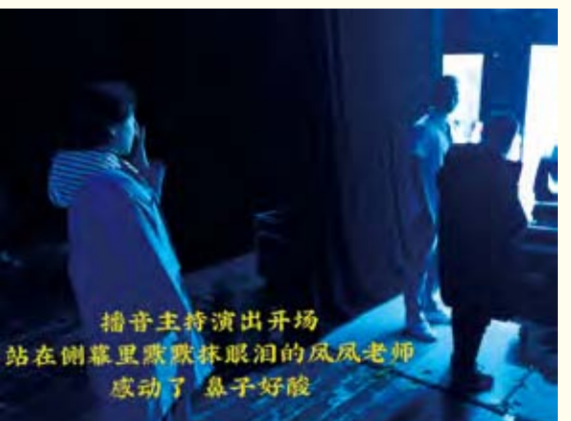
播音主持演出现场 站在侧幕里默默抹眼泪的凤凤老师 感动了 鼻子好酸