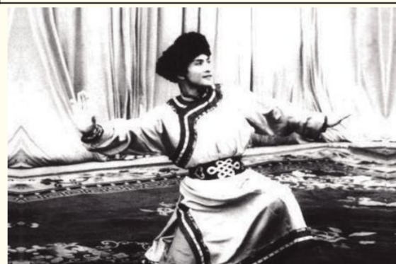
上世纪50年代,贾作光演出《鄂尔多斯》

乌兰杰先生曾说过:“贾作光、赵宋光、辛沪光、莫嘉琅、吕宏久等,这样一些外来的老师,与内蒙古各民族同胞一起共同谱写了可歌可泣的民族艺术教育诗篇。”让我们永远铭记这位舞蹈艺术大师的贡献和情谊。(张世超)