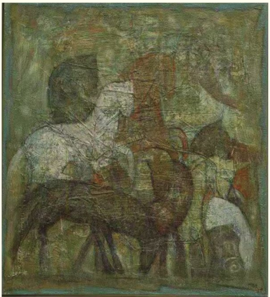
马媛《寻迹》(综合材料)