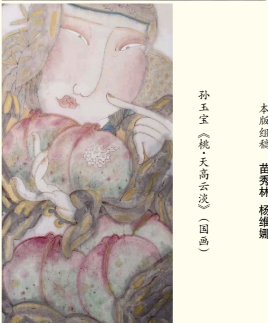
孙玉宝《桃·天高云淡》(国画)