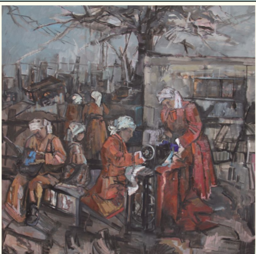
包双梅《希里亚特故事》(油画)