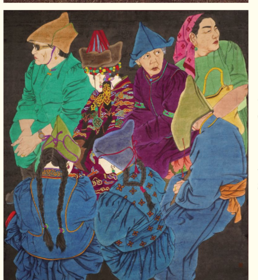
苏茹娅《希里亚特婚礼》(国画)