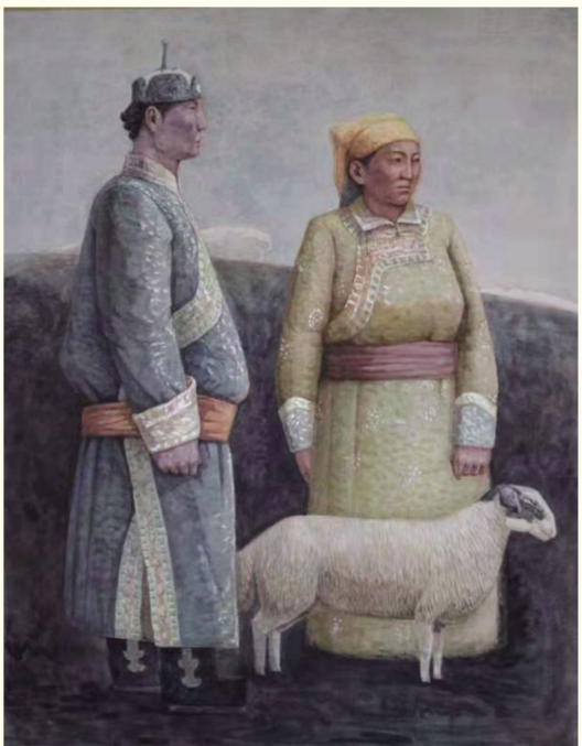
云宇峰《亘古》(水彩画)