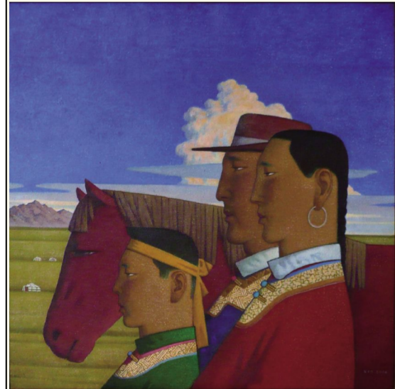
谢建德《美丽草原天长地久》(油画)