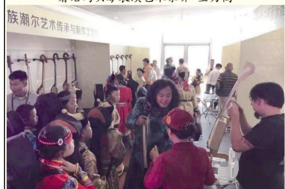
马头琴制作艺术精品展览现场