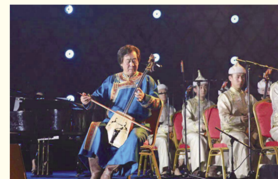
著名马头琴表演艺术家李波