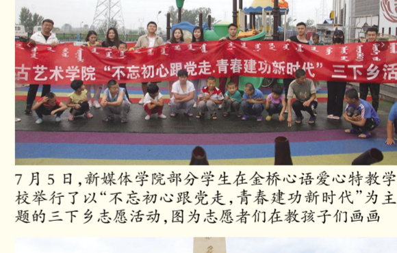
7月5日,新媒体学院部分学生在金桥心语爱心特教学校举行了以“不忘初心跟党走,青春建功新时代”为主题的三下乡志愿活动,因为志愿者们在教孩子们画画