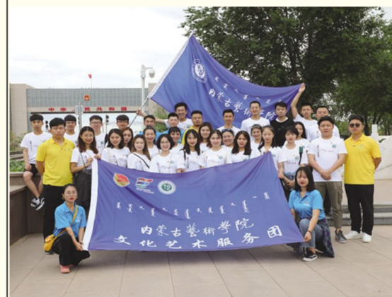
7月4日上午,我校志愿者们在二连浩特市国门开展了参观调研活动