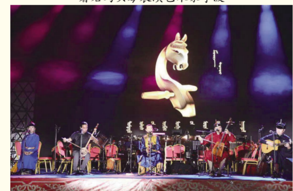
我校安达组合参加开幕式演出