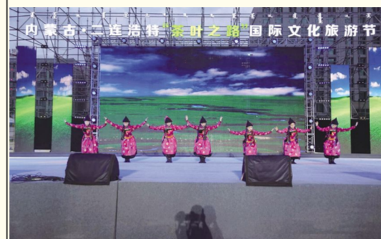
7月4日晚,在二连浩特市恐龙广场,大学生志愿者们为当地父老乡亲们献上精彩首演