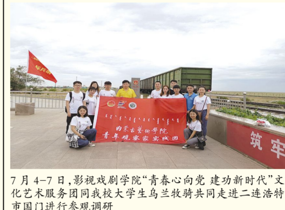
7月4-7日,影视戏剧学院“青春心向党 建功新时代”文化艺术服务团同我校大学生乌兰牧骑共同走进二连浩特市国门进行参观调研