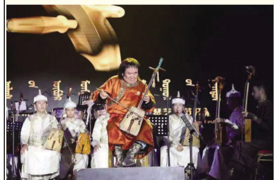
著名马头琴表演艺术家·宝力高