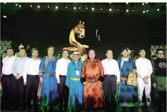
首届中国·内蒙古马头琴艺术节开幕式合影

8月16日,首届中国·内蒙古马头琴艺术节系列活动——“马头琴制作艺术精品展览”在呼和浩特市呼和浩特正式开展。共有来自国内21个厂家精心制作的200余件形制各异的现代马头琴,潮尔、叶克勒等精品乐器和一些探索性的最新产品参展。8月18日,内蒙古自治区党委常委、宣传部部长白玉刚,内蒙古艺术学院院长黄海,著名钢琴演奏家、作曲家、音乐教育家刘诗昆,马头琴大师齐·宝力高,中国民族管弦乐学会乐器改革制作专业委员会会长丰元凯等专家学者和领导嘉宾亲临展览现场。展览期间还进行了马头琴制作技艺展评比活动。同时举办了15场音乐会和“全球视野下的马头琴艺术的传承与传播”国际学术论坛、2019中国·内蒙古马头琴大赛、