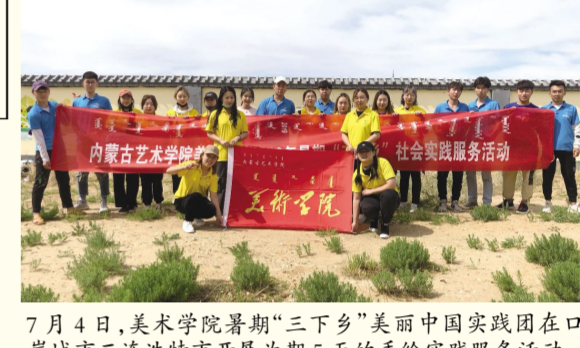
7月4日,美术学院暑期“三下乡”美丽中国实践团在口岸城市二连浩特市开展为期5天的手绘实践服务活动