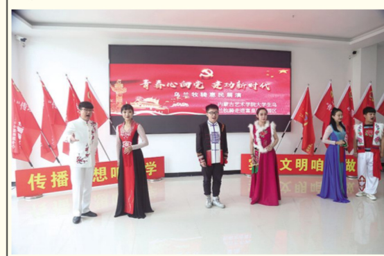
7月5日上午,我校志愿者们在二连浩特市富皇物流园开展文艺汇演