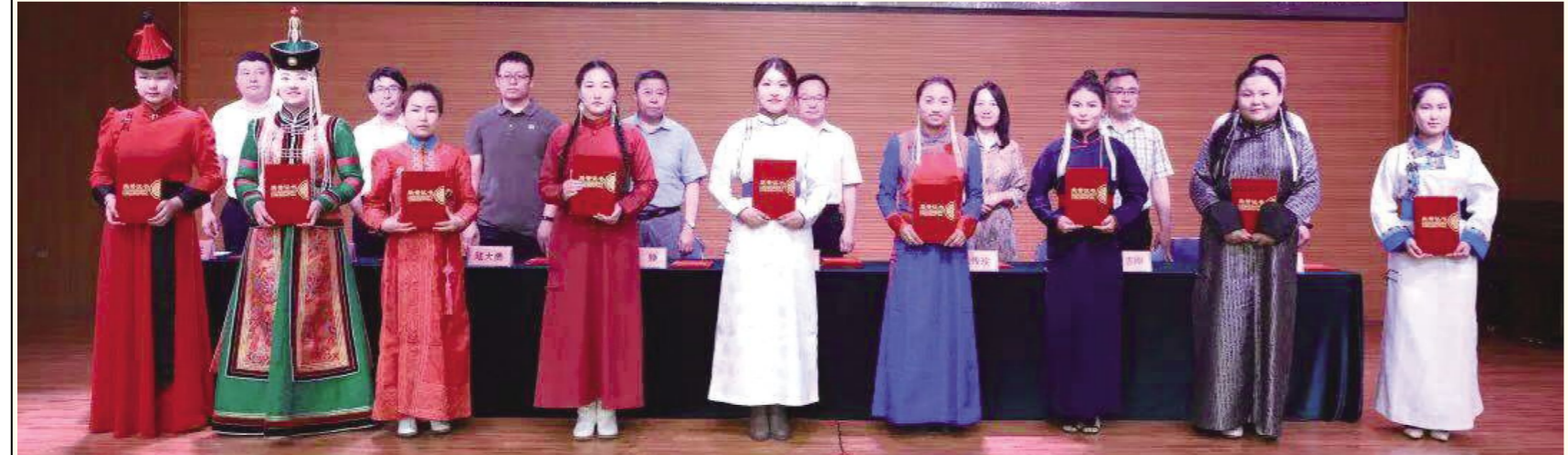
我校领导为获得“宝音德力格尔蒙古族族长调民歌奖学金”的学生颁发荣誉证书