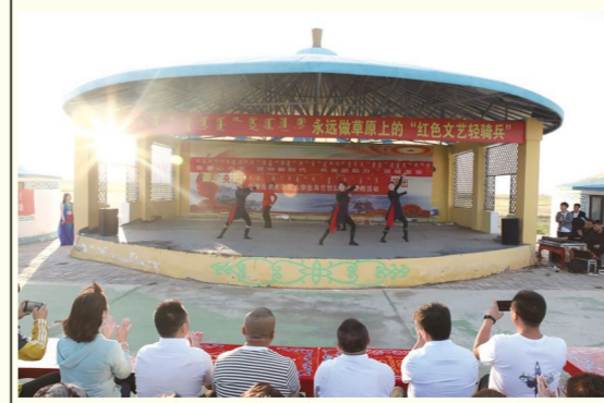
7月5日晚,我校大学生乌兰牧骑会同锡林郭勒盟苏尼特右旗乌兰牧骑的队员们,来到苏尼特右旗额仁仁尔苏木阿日善图嘎查,为当地牧民朋友献上了一场联合惠民展演