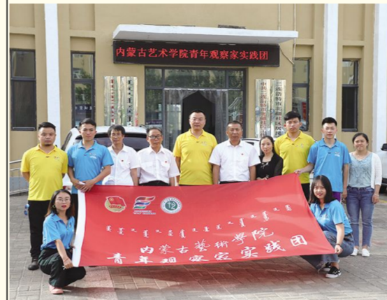
7月4日下午,我校大学生暑期“三下乡”青年观察家实践团走进二连浩特市北疆社区开展社情调研活动

志愿者们通过在社区、牧区、国门、边防部队的参观调研和形式多样的惠民展演,以实际行动汇聚青春力量、助力精准扶贫,在实践中认识新时代、拥抱新时代,耕耘新时代,将爱国情、强国志、报国行自觉融入新时代追梦征程,为新中国七十华诞献上了一份深深的情意。