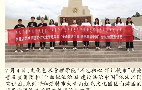
7月4日,文化艺术管理学院“不忘初心 牢记使命”理论普及宣讲团和“全面依法治国 建设法治中国”依法治国宣讲团,来到呼和浩特市大青山红色文化园区向游园的市民宣讲依法治国相关理论与政策