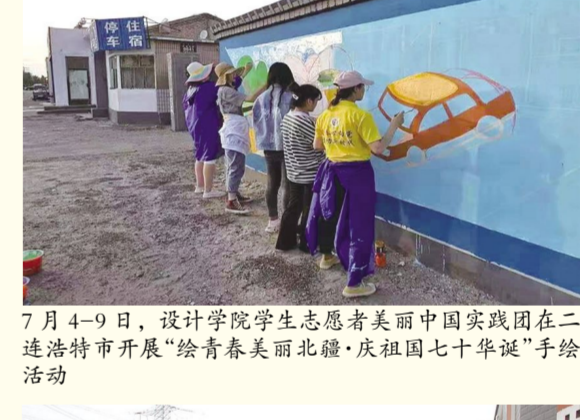
7月4-9日,设计学院学生志愿者美丽中国实践团在二连浩特市开展“绘青春美丽北疆·庆祖国七十华诞”手绘活动